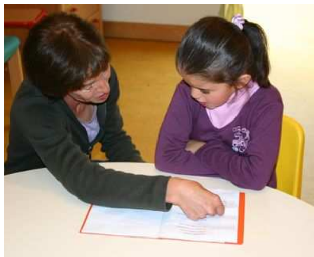
Aide aux devoirs

Pour le Baccalauréat professionnel SPVL, il est possible de valider un CAP Agent de Prévention et de Médiation en certification intermédiaire.